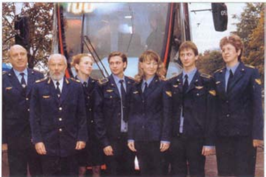
На открытии ускоренного движения трамвая (пр. Просвещения)

Председатель Первичной профсоюзной организации «Горэлектротранс» Н. П. СИЛИНА