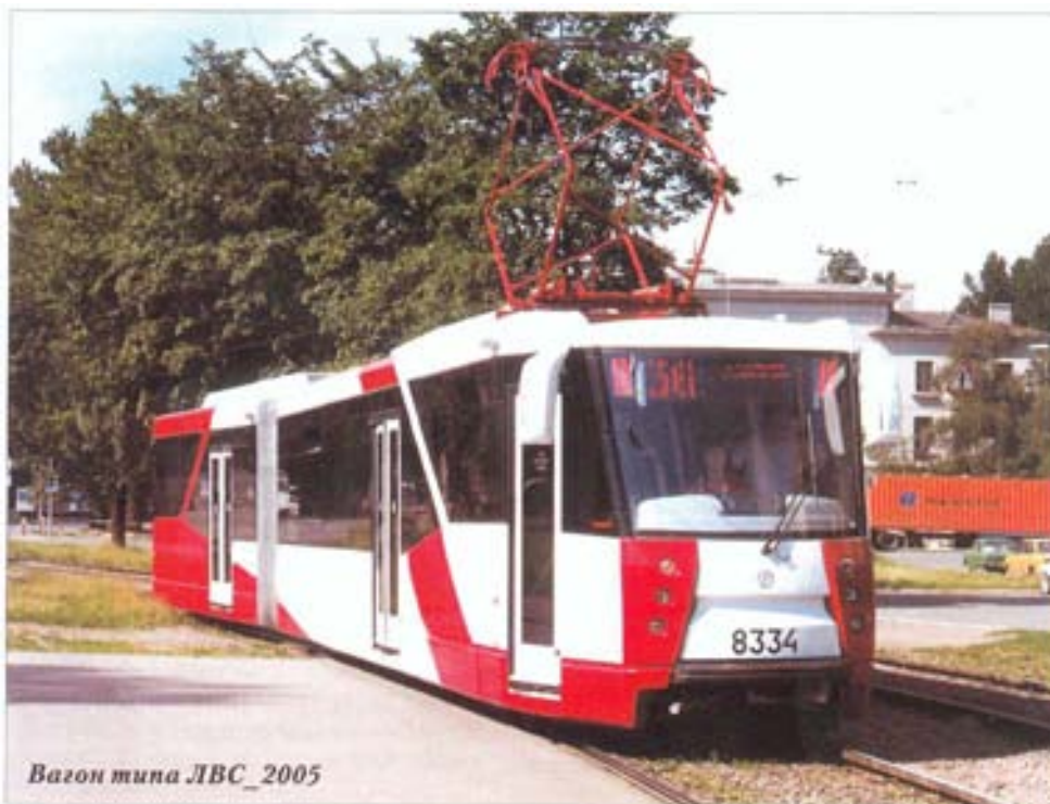
Вагон типа ЛВС_2005