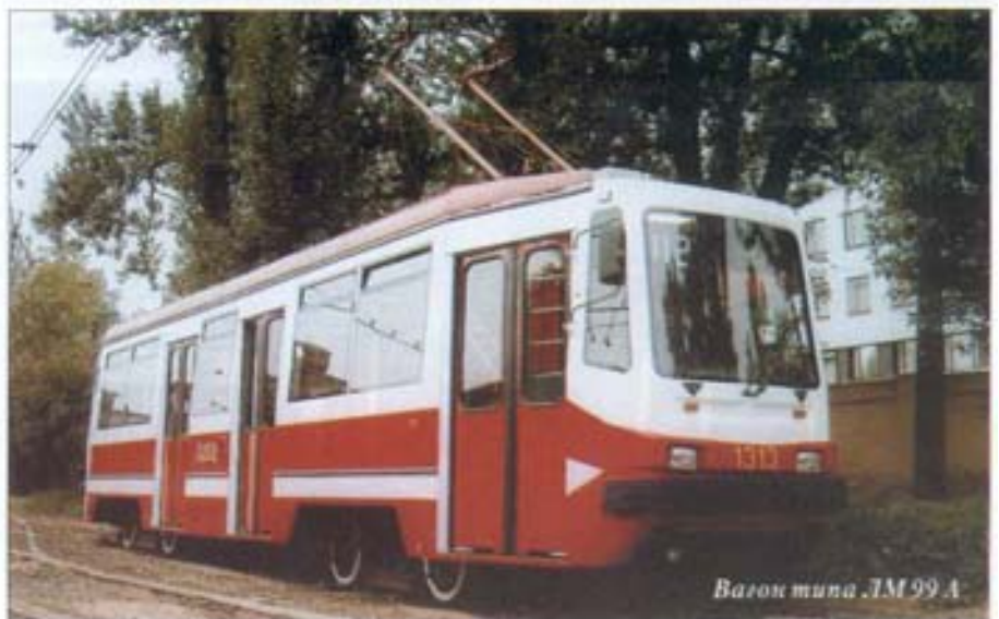
Вагон типа ЛМ 99 А